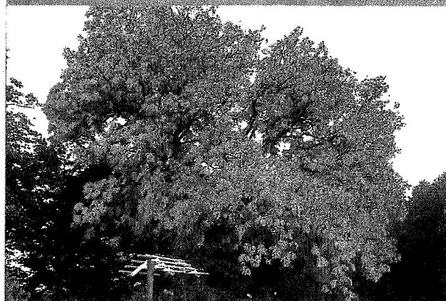
Om precies te zijn is de herfst dit jaar op 23 september om 5.09 uur begonnen. De komende periode zullen de bomen geel en kaal worden en zal de temperatuur gaan dalen...

verkeersveiligheid. Voor deze werkzaamheden is een nieuwsbrief opgesteld, deze vindt u op de gemeentelijke website.